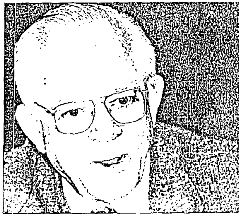
CARLOS ROMERO BARCELÓ